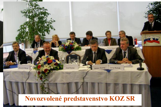
Novozvolené predstavenstvo KOZ SR