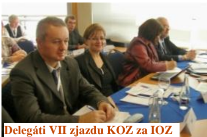
Delegáti VII zjazdu KOZ za IOZ

Odbory v tomto kontexte majú veľmi dôležitú úlohu, lebo zastávajú tých, ktorých sa všetky otrasy najviac dotýkajú. Konfederáciu odborových zväzov SR čaká neľahké štvorročné obdobie, v ktorom musí nájsť sociálne a politické riešenia, ako čo najlepšie ochrániť svojich členov.