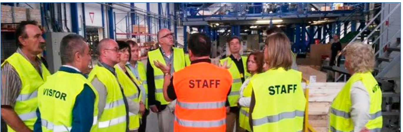
Počas rokovania P IOZ v Malackách bola príležitosť pozrieť výrobné priestory fy IKEA.