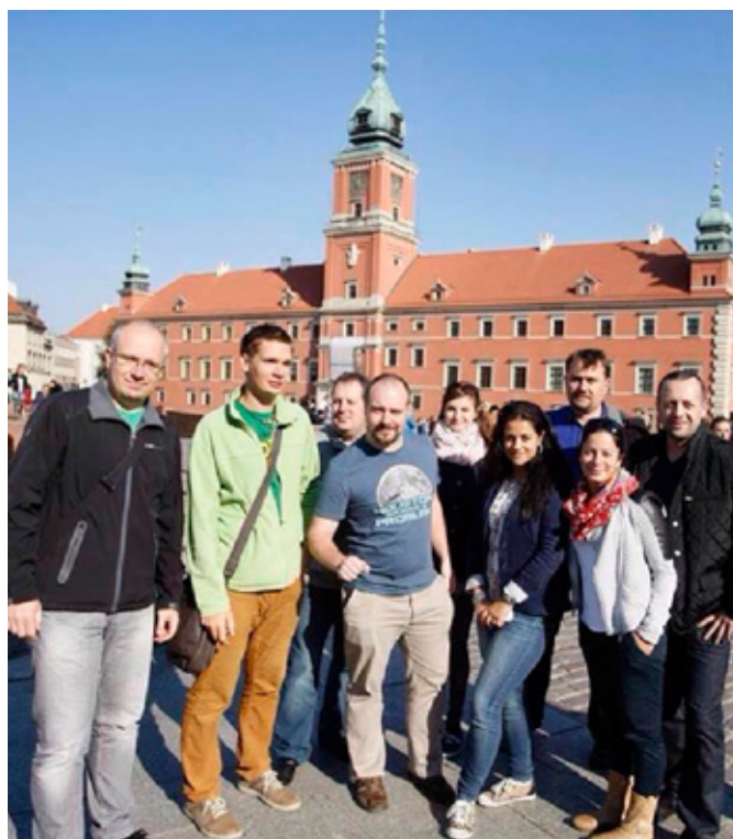
Slovensko-česká skupina CEYTUN