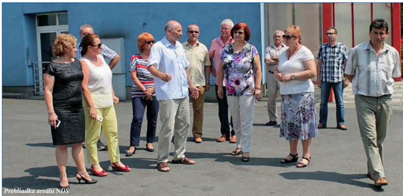
Prehliadka areálu NDS

vedomie a uložilo prerokovať ich v nadchádzajúcom sneme (viď Snem IOZ). Boli tiež prerokované úlohy v oblasti medzinárodnej a s tým spojená účasť zástupcov odborového zväzu na aktivitách v zahraničí. V rôznom bola prerokovaná komplexná príprava 5. Snemu IOZ.