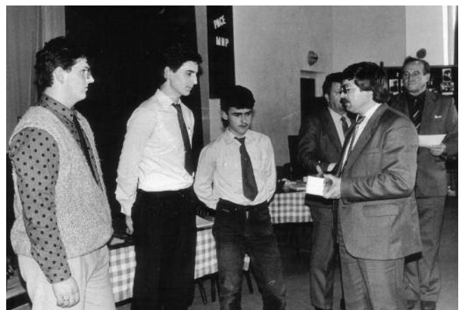
1989 - Odovzdávanie cien