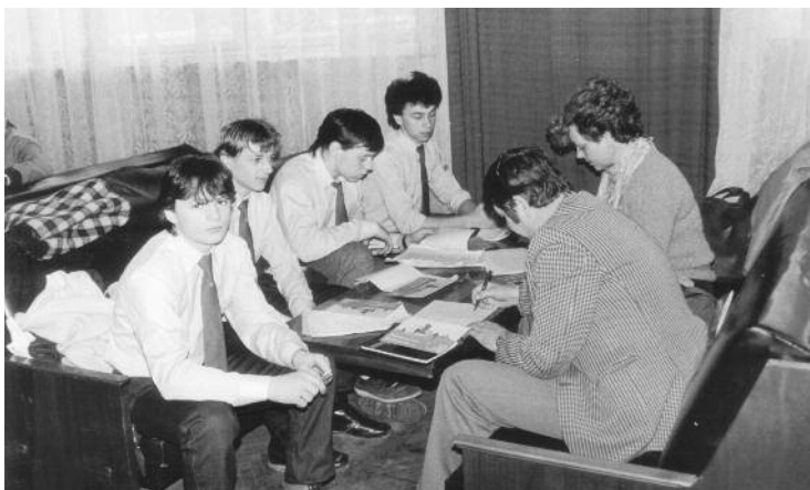
1987 - Príprava žiakov