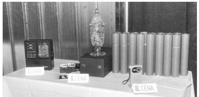
1989 - Ceny pre víhercov