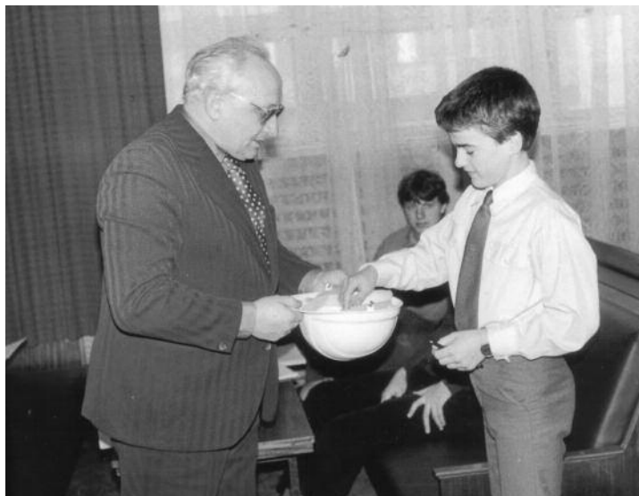
1987 - Losovanie poradia