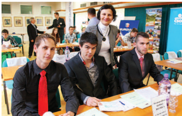
2014 - Zúčastnení študenti