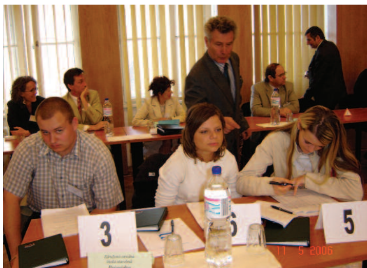
2006 - Zúčastnení študenti