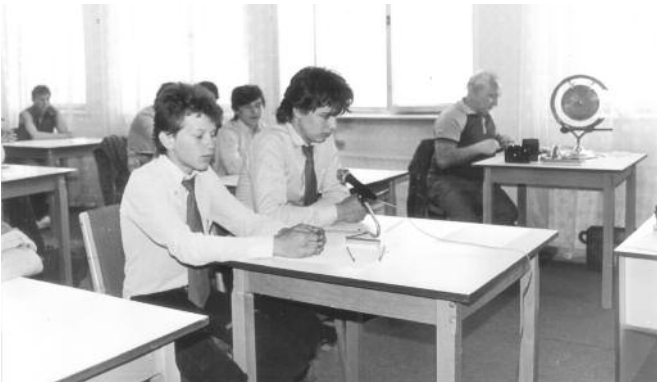
1986 - Súťažiaci a časomerač