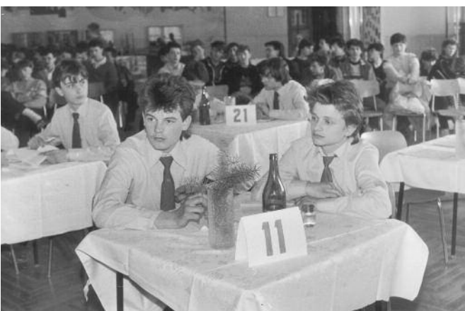
1988 - Súťažiaci