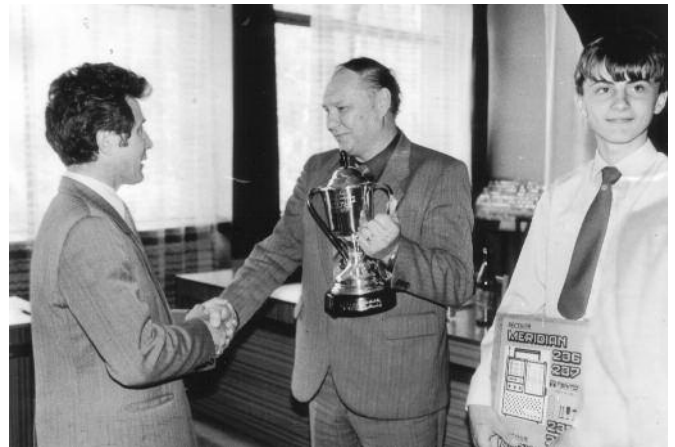
1988 - Odovzdávanie cien