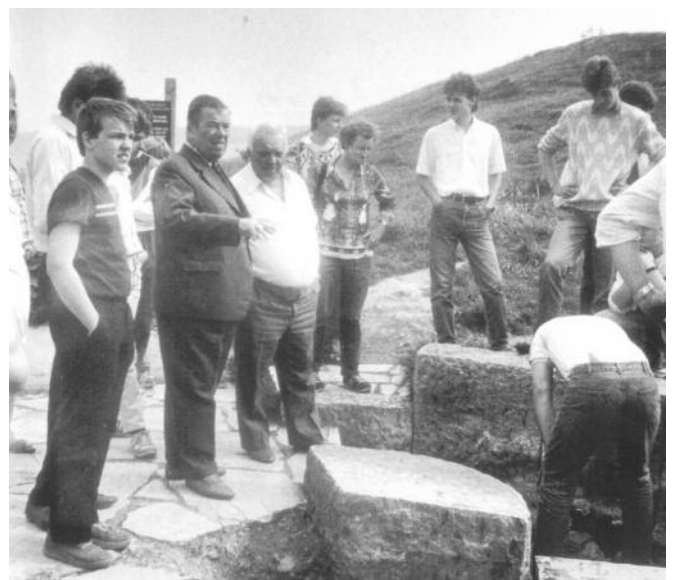
1989 - Na Spišskom hrade