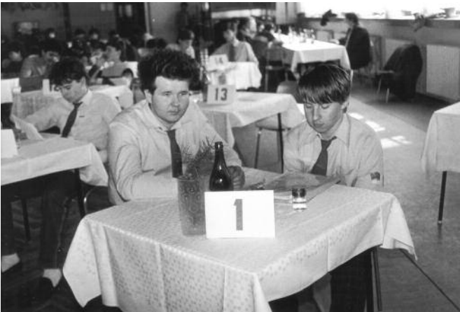
1988 - Súťažiaci