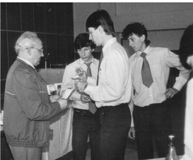
1986 - Odovzdávanie cien