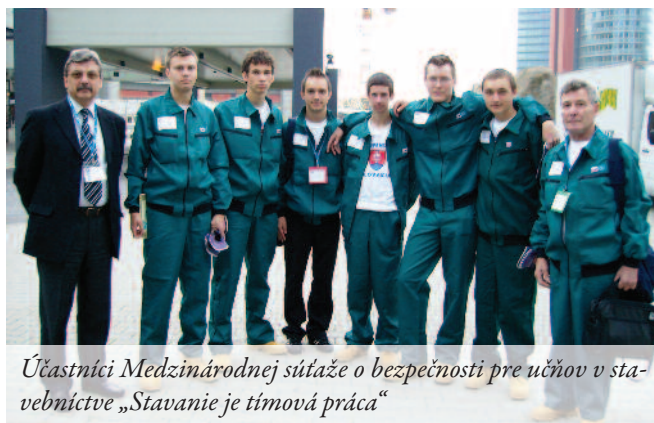
Účastníci Medzinárodnej súťaže o bezpečnosti pre učňov v stavebníctve „Stavanie je tímová práca“

Prví traja vyššie uvedení víťazi celoslovenského kola súťaže dostali od rakúskych priateľov pozvanie na ich 5. ročník rovnej súťaže - rakúskej olympiády , ktorá sa konala v júni v rakúskom Schladmingu , kde boli naši žiaci iba pozorovateľmi a hosťami.