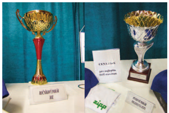
Ročníkový pohár IOZ a putovný pohár prezidenta ZSPS