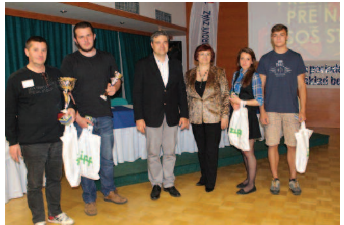
Najlepšia stavebná škola - SOŠ stavebná Žilina