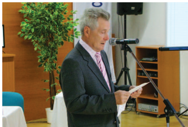
Prihovor nestora súťaže