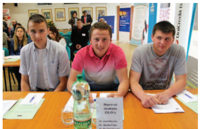
Súťažiaci z Dopravej akadémie Žilina