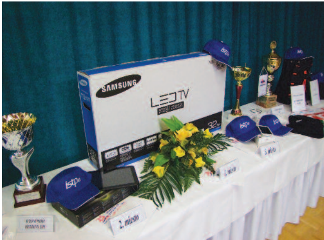
Ceny pre víťazov, putovný pohár a ročníkový pohár IOZ, putovný a ročníkový pohár prezidenta ZSPS