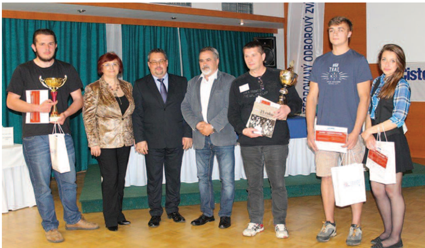
Vítazná SOŠ stavebná Žilina