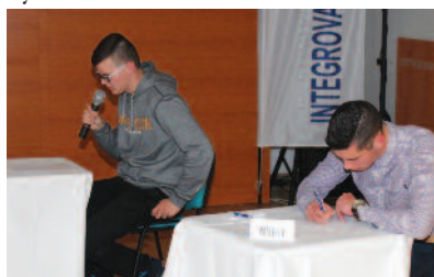
Príprava a odpoveď súťažiacich

Aktérmi súťaže boli trojčlenné súťažné tímy zo stredných odborných škôl so zameraním na stavebníctvo, automobilový priemysel, dopravu, lesníctvo, obchod a služby a školy technického charakteru. Súťažili chlapci a dievčatá, ktorí sa umiestnili na prvých troch miestach vo svojich školách na školských kolách, v súlade s Propozíciami.