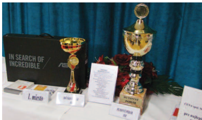
Putovný pohár IOZ a cena partnera súťaže

Výnimočnosťou tohto ročníka bolo ocenenie prezidenta Zväzu stavebných podnikateľov Slovenska ročníkovými pohármi tých stavebných škôl, ktoré sa umiestnili na 2. a 3. mieste.