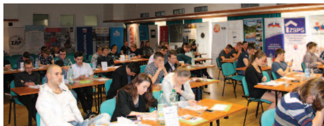
Priebeh testovej časti súťaže