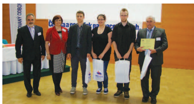
3. miesto - Spojená škola Kremnička Banská Bystrica s prezidentom KOZ SR