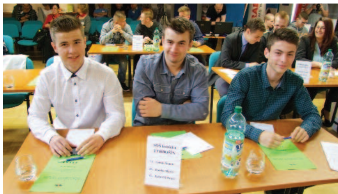
Žiaci zo SOŠ lesnícka Tvrdošín