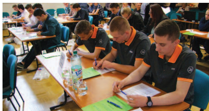
Žiaci zo SOŠ technická Prešov

V súlade s Propozíciami sa súťaž uskutočnila v dvoch kolách a to školské, ktoré sa uskutočnili do 15. apríla 2016, organizátormi boli jednotlivé stredné odborné školy v spolupráci s IOZ a celoštátne kolo sa uskutočnilo 4.- 5. mája 2016, organizátor Integrovaný odborový zväz.