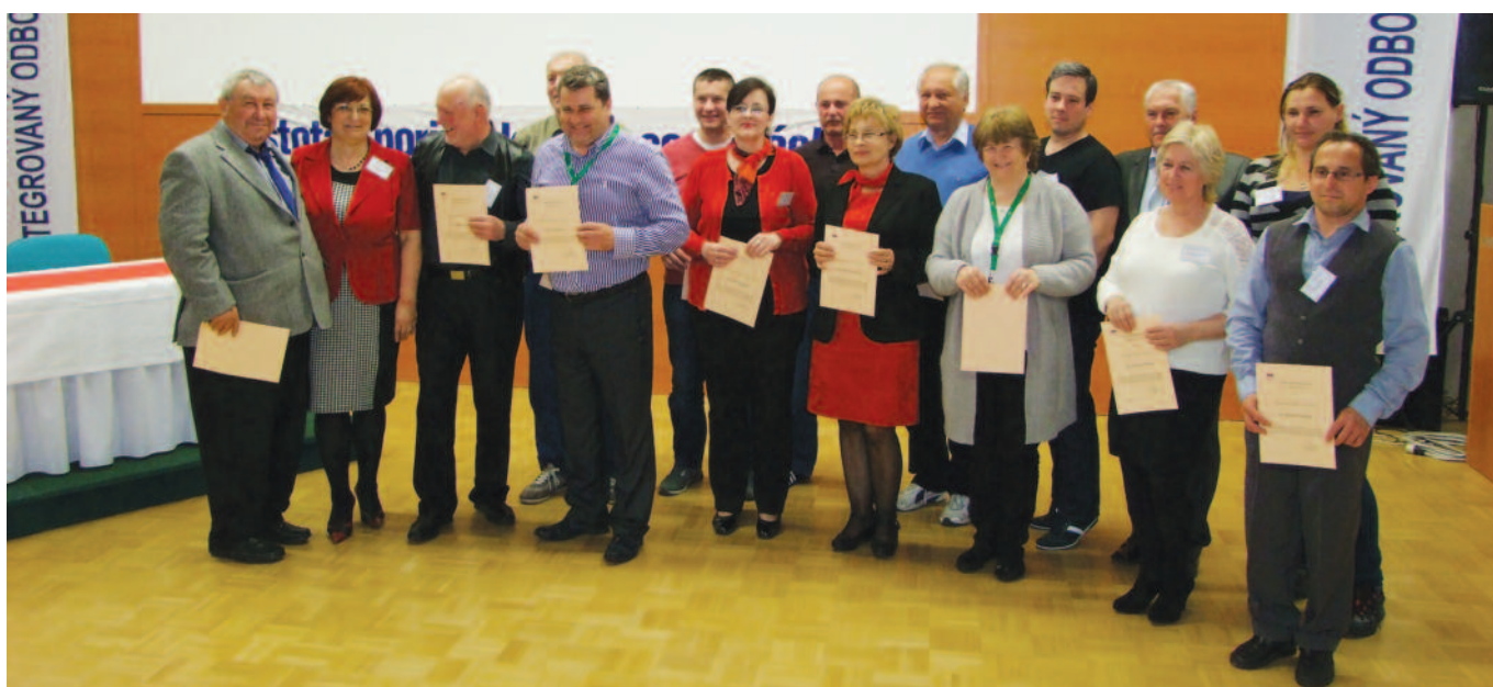
Pedágovia súťažiacich škôl s Ďakovnými listami IOZ