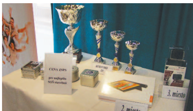
Putovný pohár ZSPS a ceny od partnerov súťaže