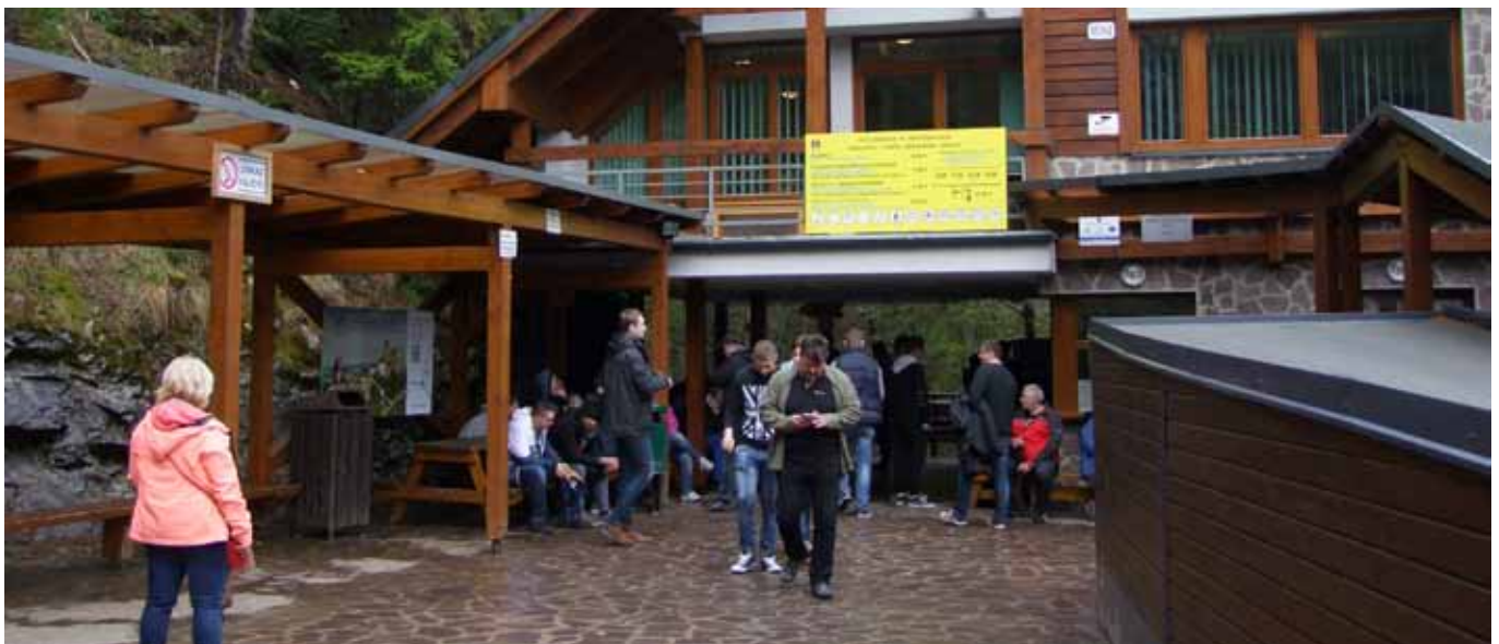
Pred Belianskou jaskyňou