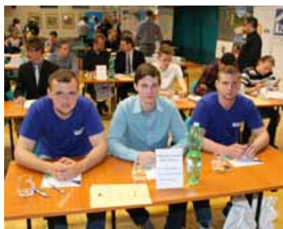
Žiaci SOŠ polytechnickej Zlaté Moravce

Tak ako základných kôl aj celoštátneho kola sa zúčastnili trojčlenné súťažné tímy zo stredných odborných škôl so zameraním na stavebníctvo, automobilový priemysel, dopravu, lesníctvo, obchod a služby a školy technického a polytechnického charakteru.