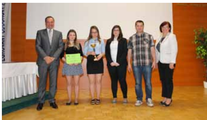
3. miesto - Stredná odborná škola stavebná Žilina