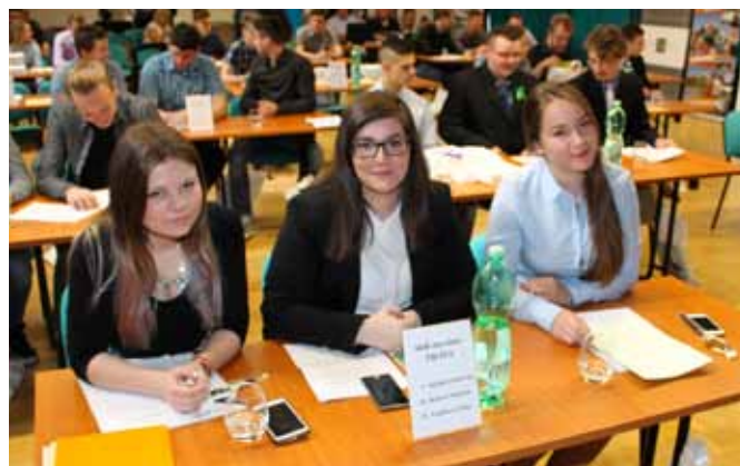
Žiačky SOŠ stavebnej Žilina

43. ročník celoštátneho kola v roku 2017 sa zúčastnili žiaci 13 škôl: