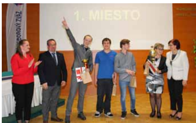
1. miesto - Stredná odborná škola Prievidza