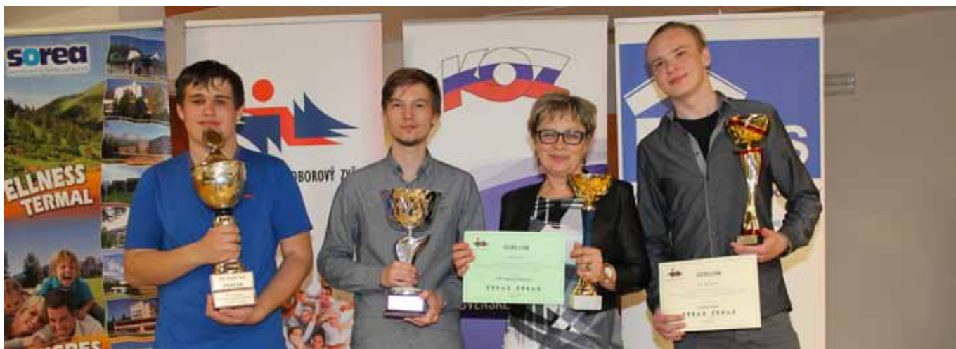
Vítavná škola – SOŠ Prievidza v súťaži SOŠ a v súťaži stavebných škôl