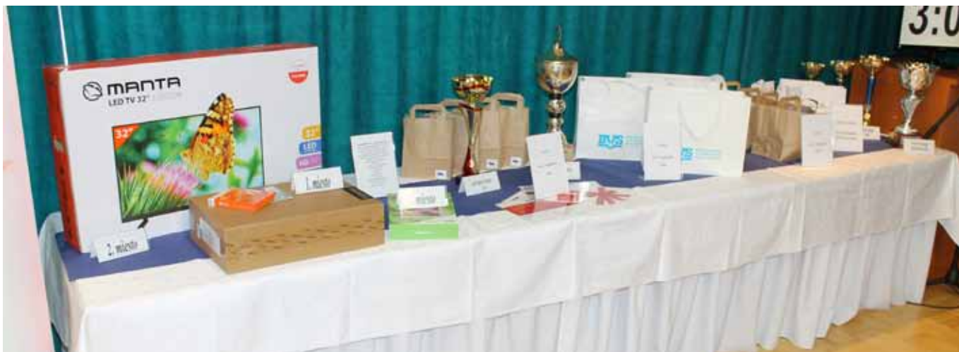
Ceny od partnerov súťaže