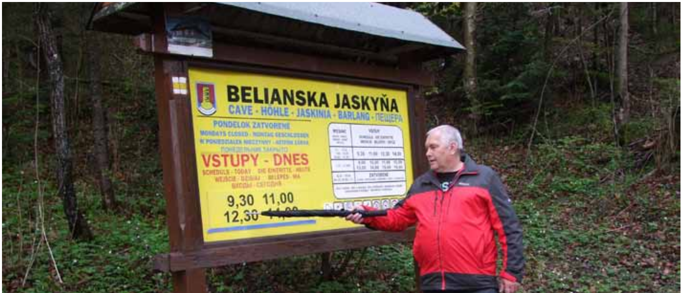
Výlet do Belianskej jaskyne

Na druhý deň, po úspešnom ukončení „pracovného pobytu“ súťažiaci žiaci a ich pedagógovia aktívne zrelaxovali a navštívili Beliansku jaskyňu, ktorá patrí medzi najviac navštevované sprístupnené jaskyne na Slovensku.