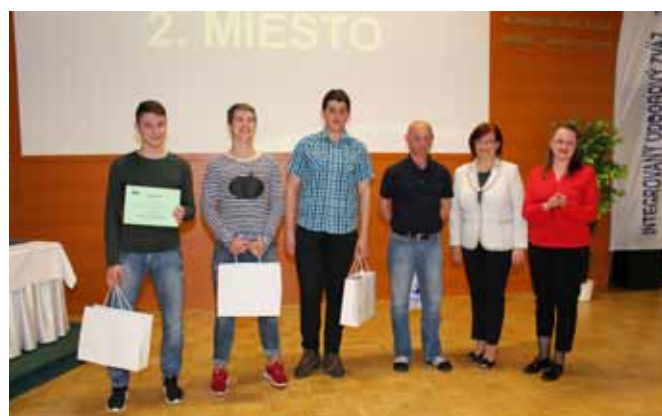
2. miesto - Stredná odborná škola lesnícka Tvrdošín