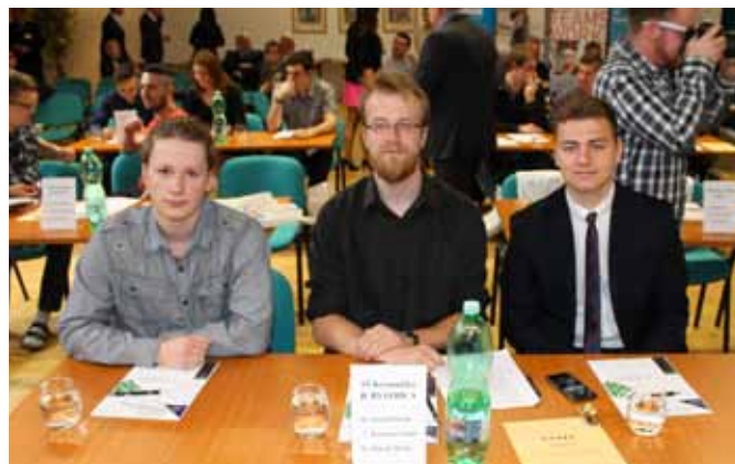
Žiaci SŠ Kremnička Banská Bystrica

Súťažili chlapci a dievčatá, ktorí sa umiestnili na prvých troch miestach na základných – školských kolách, v súlade s propozíciami vydanými Integrovaným odborovým zväzom k organizovaniu 43. ročníka súťaže.