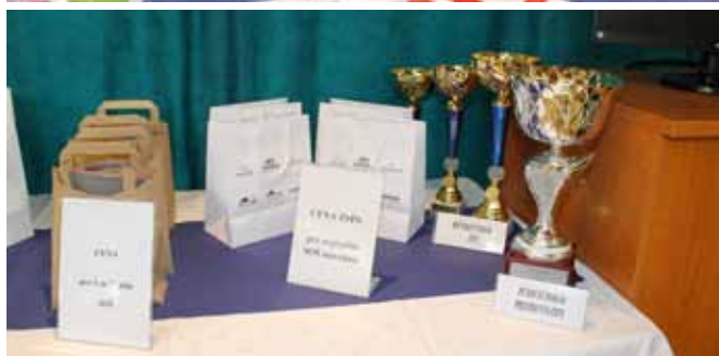
Ceny od partnerov súťaže

Vitazná škola získala aj ročníkový a putovný pohár Integrovaného odborového zväzu .