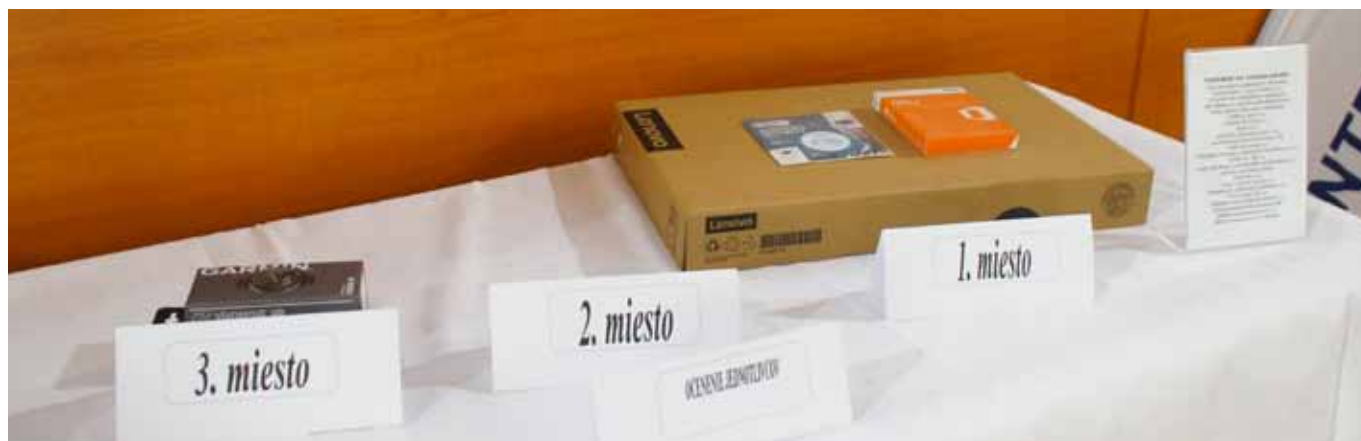
Ceny pre najlepších jednotlivcov od partnerov súťaže