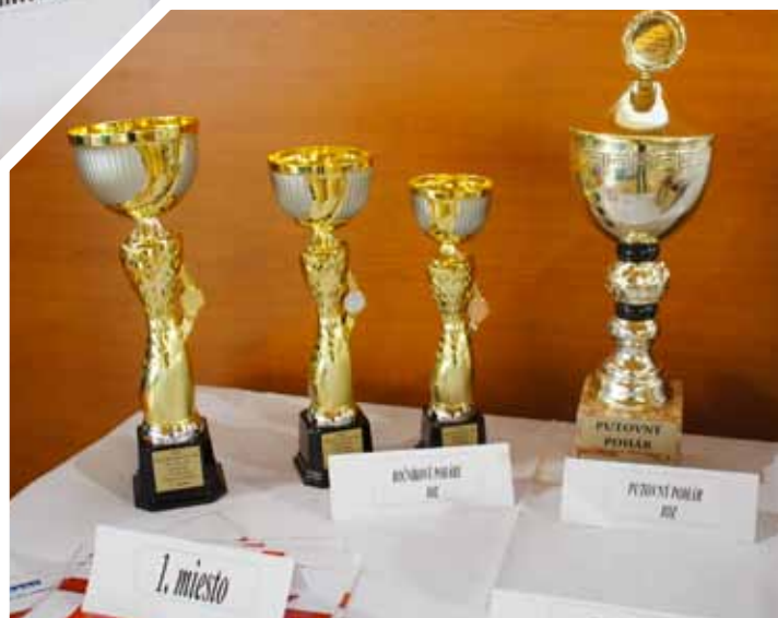
Vítazné poháre IOZ + cena SOREA