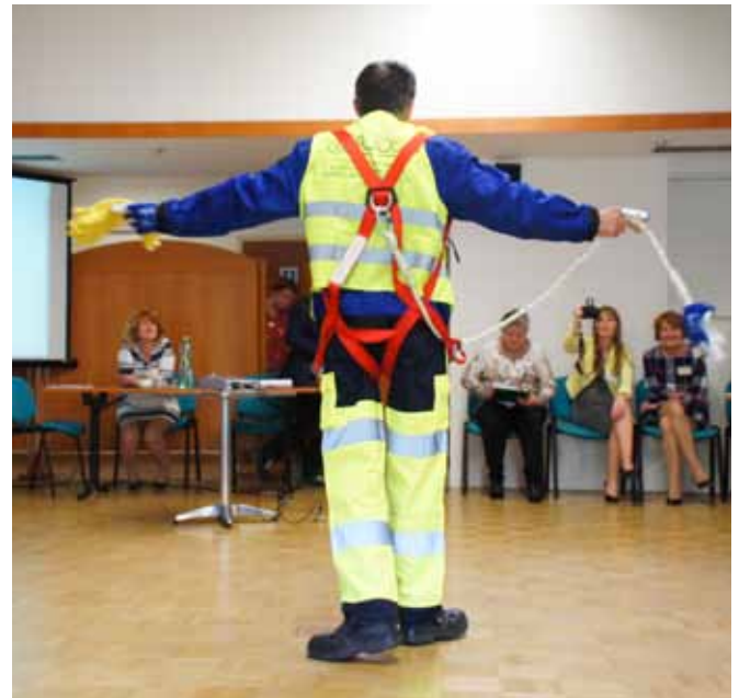
Praktická časť súťaže – figurant