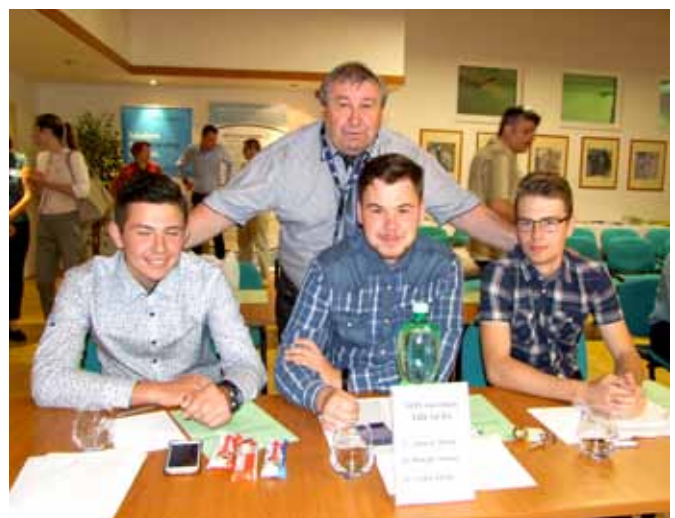
Stredná priemyselná škola stavebná Emila Belluša Trenčín