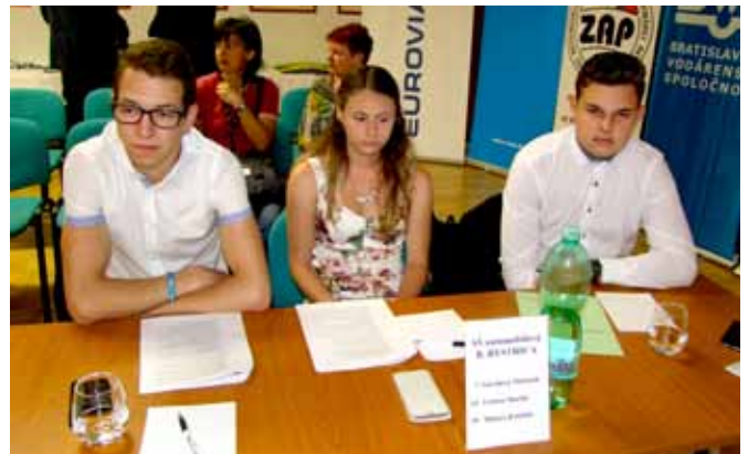
Spojená škola automobilová, Banská Bystrica