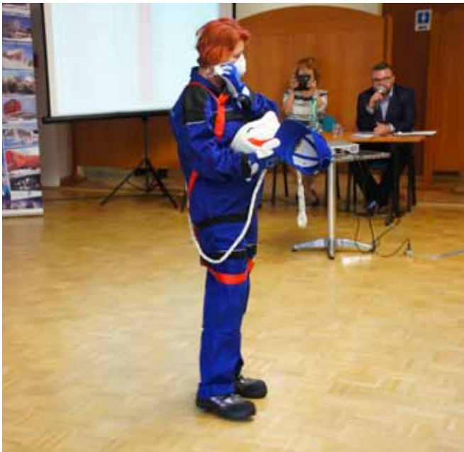
Praktická časť súťaže – figurant