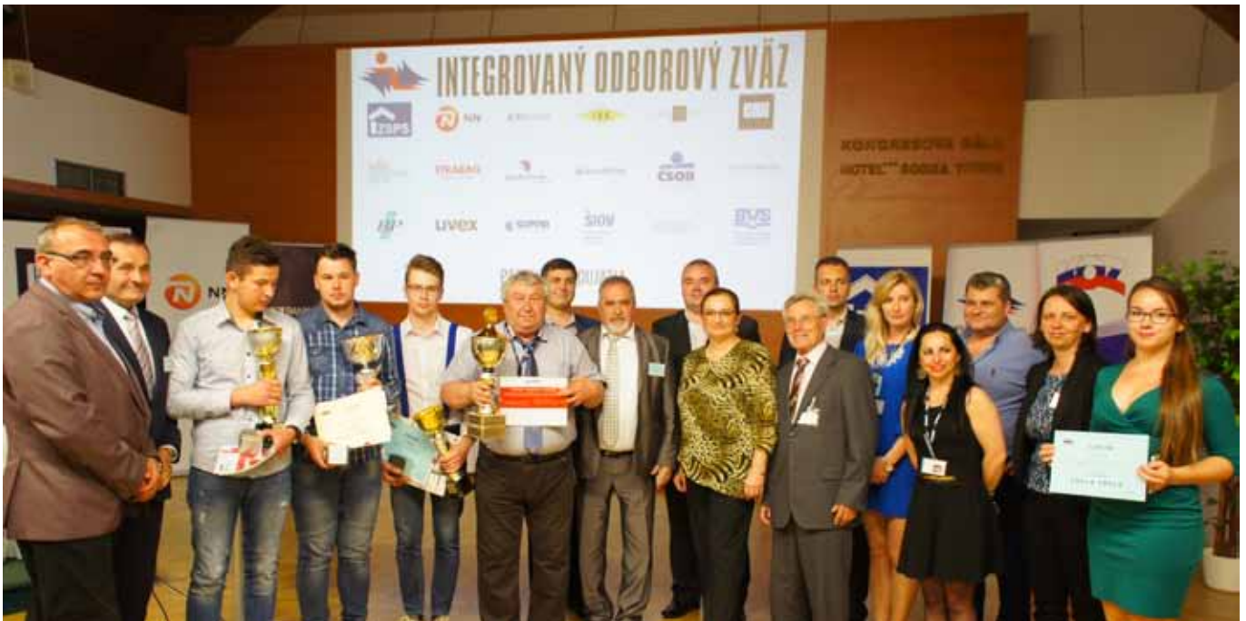
Vítaná škola s partnermi a organizátormi súťaže