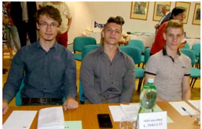
SOŠ stavebná, Liptovský Mikuláš