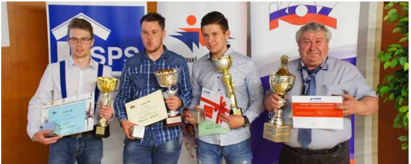
Vítaná škola + najlepšia stavebná škola – Stredná priemyselná škola stavebná Emila Belluša Trenčín