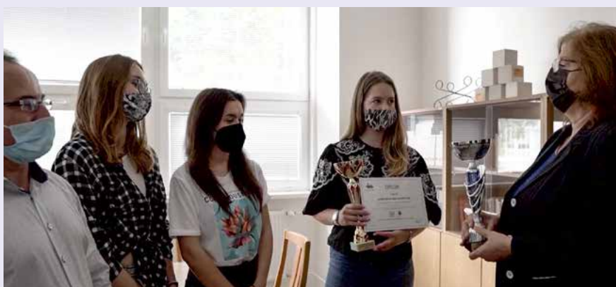
2. miesto Stredná odborná škola stavebná Nitra