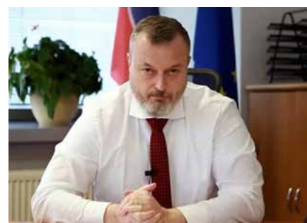
Minister práce, sociálnych vecí a rodiny SR Milan Krajniak