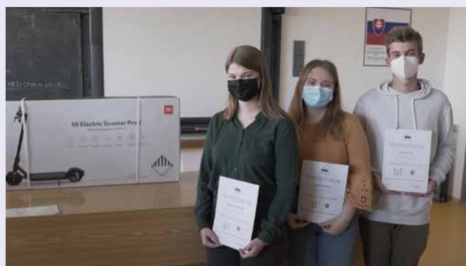
1. miesto a najlepšia stavebná škola Stredná priemyselná škola stavebná Emila Belluša Trenčín

Umiestnenie prvých troch najlepších škôl so stavebným zameraním bolo totožné s výsledkami najlepších škôl ako absolútnych víťazov: