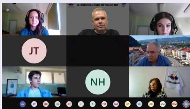
Účastníci celoštátneho kola