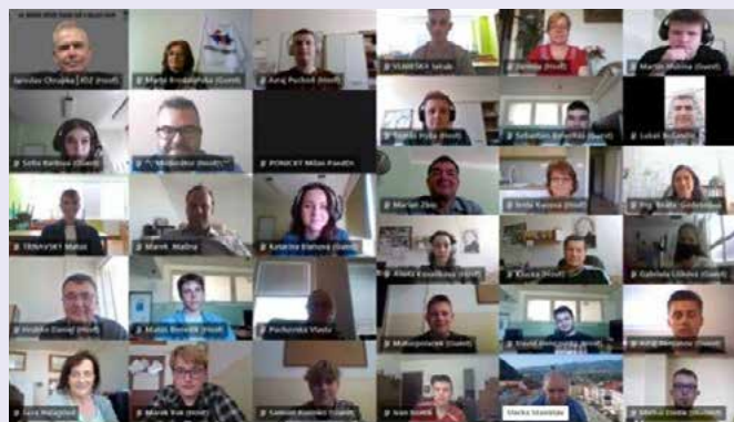
Účastníci celoštátneho kola