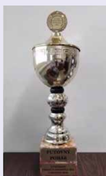
Putovný pohár IOZ pre víťaza celoštátneho kola