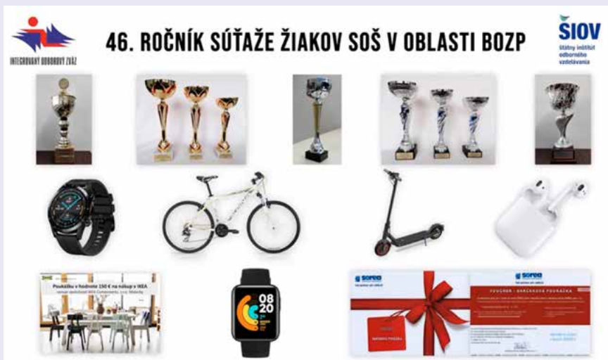
Ceny od partnerov súťaže

Positívom je, že každoročne stúpa počet škôl súťaže so stavebným zameraním, ako aj kvalita obsahovej stránky prípravy. O tom svedčí aj poradie víťazných škôl a to, že na prvých troch miestach sa v tomto ročníku umiestnili školy, ale aj jednotlivci so stavebným zameraním. Túto skutočnosť možno vnímať aj ako rastúci záujem mladých ľudí o odvetvie stavebníctva, stavebné profesie.