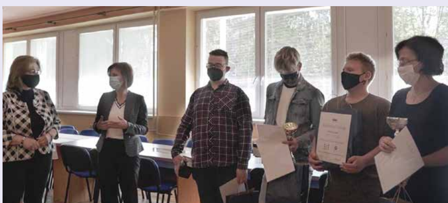
3. miesto Stredná odborná škola technická Prešov