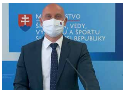
Minister školstva, vedy, výskumu a športu SR Branislav Gröhling